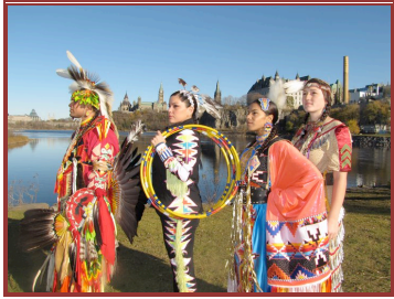
Expériences autochtones, Ottawa, Ontario

L'Association touristique autochtone du Canada (ATAC) comprend plus de 20 organisations de l'industrie du tourisme autochtone ainsi que des représentants des gouvernements de chaque province et territoire du Canada. Grâce à la voie unifiée de l'industrie touristique autochtone, l'ATAC concentre sur le marketing, l'appui au développement de produits, et la création de partenariats entre les associations, les organisations, les ministères et les leaders de l'industrie de partout au Canada pour soutenir la croissance du tourisme autochtone au Canada.