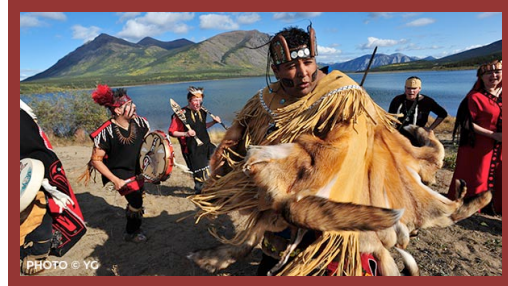
L'association touristique des premières nations du Yukon