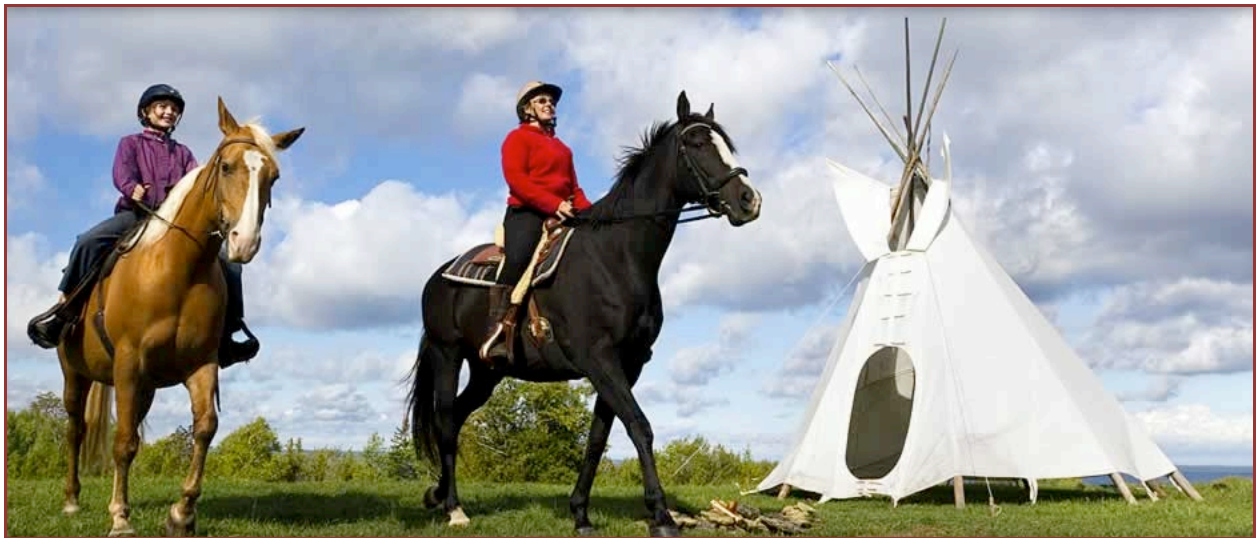
Great Spirit Circle Trail, M'chigeeng, l'Ontario