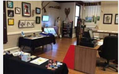
Sipuke'l Gallery, Nova Scotia.

Dans les pages qui suivent, les propriétaires d'entreprises partagent comment ces subventions les aident à surmonter les obstacles, à créer des entreprises viables et à contribuer à la croissance économique du tourisme autochtone au Canada. Ensemble, nous visons à bâtir une industrie prospère qui inspire les visiteurs d'ici et d'ailleurs.