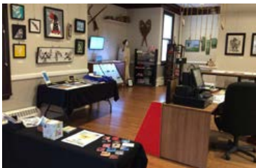
Sipuke'l Gallery, Nova Scotia.

From training a young person to guide visitors through ancient sites, to buying paddleboards, canoes or helping with down-payments on specialized snowmobiles for guests, the Indigenous Tourism Association of Canada's Product Development Fund is making a huge difference for Indigenous tourism operators from coast to coast to coast.