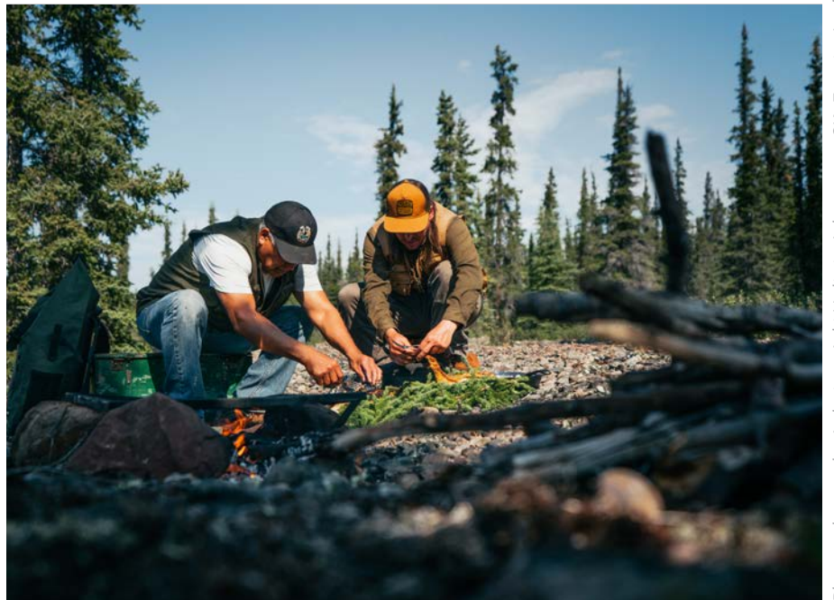
Photos, de gauche à droite : Aski Holistic Adventures, SK; Frontier Lodge, TN-O. Photo, couverture : Lennox Island Development Corporation, Î-P-É